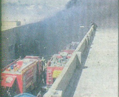
ہاگس بے ٹرک اڈا کے قریب گودام میں لگی آگ کو فائر بریگیٹوں نے قابو کیا۔

گیت نمبر 6 پر گورنمنٹ کالج کراچی (انسٹاف) کے قریب گودام میں خود روپے مالیت کا سامان حمل باجوہ آگ پر حمل قابو پایا۔