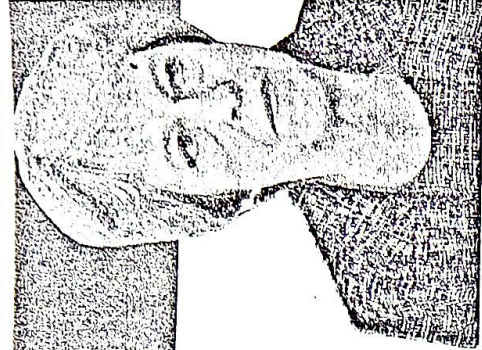
Asks EU to delay Britain's departure till June 30 United Kingdom Prime Minister THERESA MAY

SATURDAY Rajab 29, 1440 | April 06, 2019